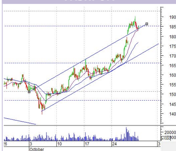
График «Газпрома» (ч)

Ярко выраженный растущий тренд. В четверг бумага открылась с «гэпом» вверх и пробила верхнюю границу коридора. Акция не смогла закрепиться выше уровня сопротивления на 185.