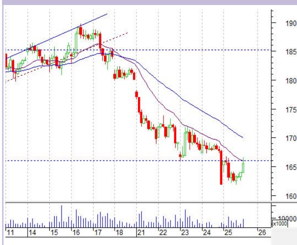
График «Газпрома» (ч)

В понедельник «Газпром» открылся сразу с «гэпом» вниз и за неделю лихо прошел путь до уровня поддержки, который не устоял.