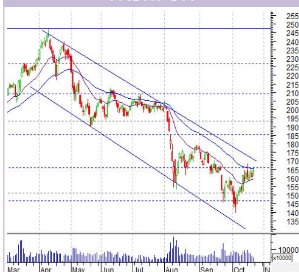
График «Газпрома» (д)

«Газпром» уперся в уровень сопротивления на 166. Всю неделю торги шли под ним. У этого уровня сейчас находится еще и медленная скользящая.