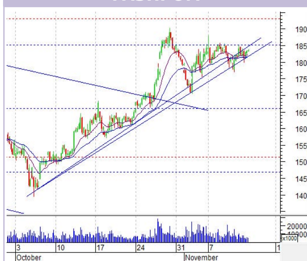
График «Газпрома» (ч)

Акция уперлась в уровень сопротивления на 185 и никак не может его пройти. От движения вниз удерживает граница растущего тренда.