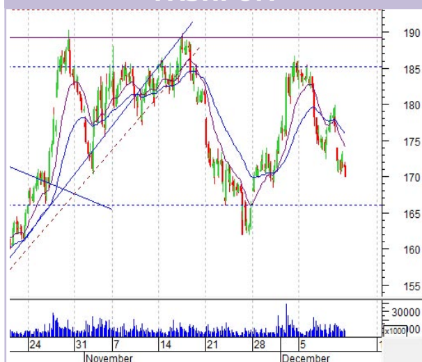
График «Газпрома» (ч)

Фигура «перевернутые голова и плечи» не была реализована. Акции «Газпрома» снижались всю неделю, дважды открываясь с гэпом вниз. Формально можно считать, что первый гэп закрыт. Второй же - нет.