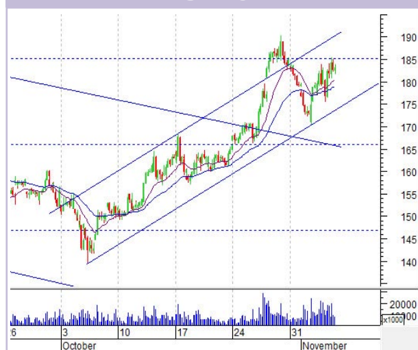
График «Газпрома» (ч)

Нам удалось заработать на движении вниз. Позиции у нас закрыло по «стопу».