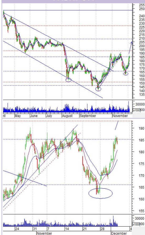
График «Газпрома» (ч)

Еще глядя на график недельной давности, были подозрения на перевернутую фигуру «голова-плечи». Сейчас эти подозрения стали еще более обоснованными.